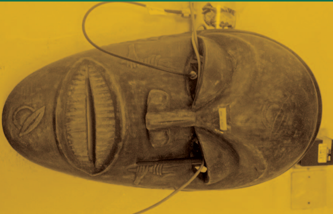
▲ Antenne sans fil derrière un masque.