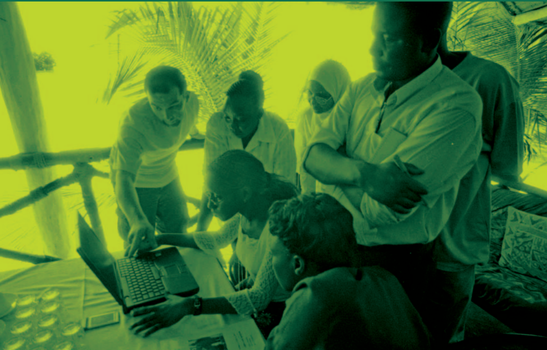
▲ Training community computer techies.