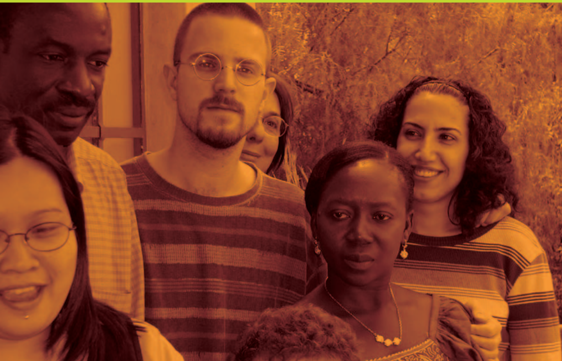
▲ Participantes en una capacitación de periodistas web.