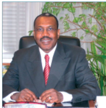
Hamadoun Touré considera que las TIC constituyen una oportunidad para el África

El FSD es muy positivo ya que ofrece una nueva alternativa de financiación. Gracias al Fondo, pueden existir proyectos concretos, sustentados por las microfinanciaciones. Se trata de un fondo voluntario que viene a complementar otras iniciativas. Su creación refleja el hecho de que nos encontramos en una nueva era, en la que la sociedad civil está integrada en las iniciativas internacionales, lo que nos obliga a replantearnos nuestro «business model» para la financiación de los medios modernos de comunicación. ■